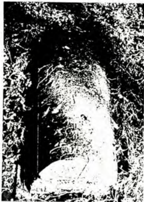
6. (... ) UNLESBAR

DES DENKMALS / DES DENKMALENSEMBLES MAßSTAB 1 : 1