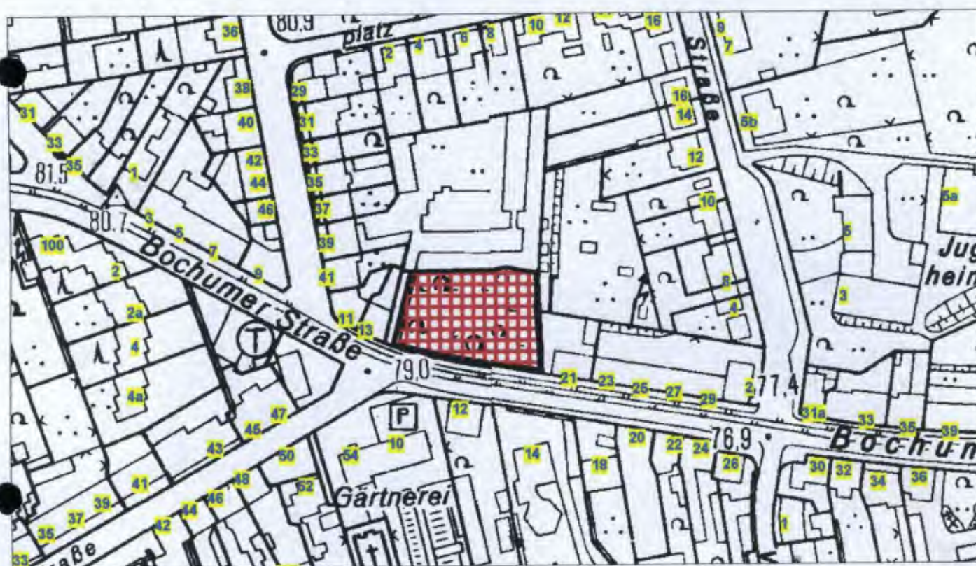
Jüdischer Friedhof / Bochumer Str.