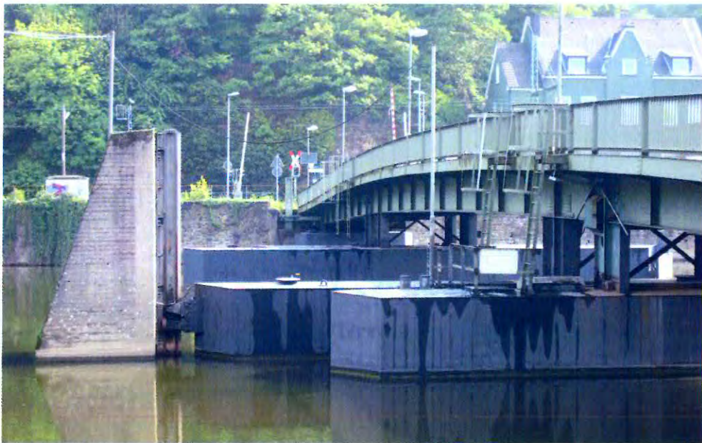
Dahlhauser Schwimmbrücke, Auf dem Stade, 2011.