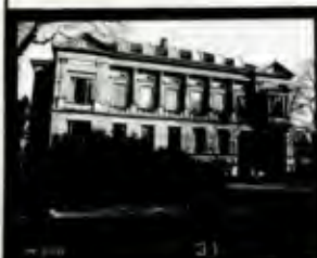
THEMA: Kortumstr. 147 ARCHIV-NR: 14149

ARCHIV-NR = REGISTRIER- NR. IM BILD- ARCHIV